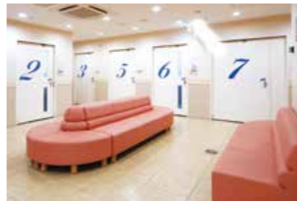
産婦人科外来待合室