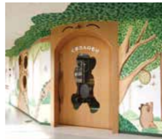
くまさんのもり 入口