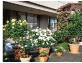
屋上庭園 (バラ園のお庭)