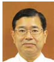
病院事業管理者兼 病院長

さらに、病院内部は、患者さんにとって、きれいで静かな療養環境を、職員にとっては働きやすい院内環境を、と心掛けています。