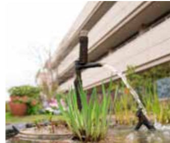
屋上庭園 (癒しの小径)