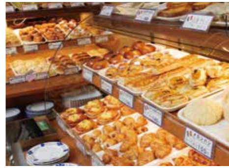
レストラン ベーカリー