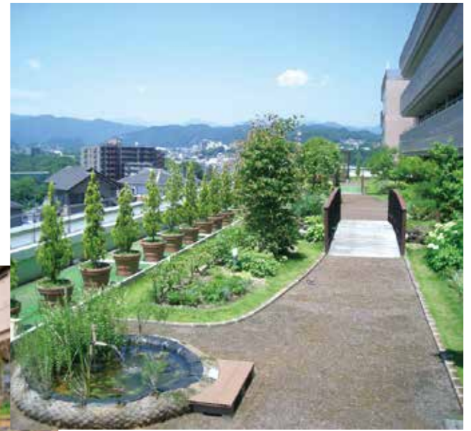
屋上庭園 (癒しの小径)